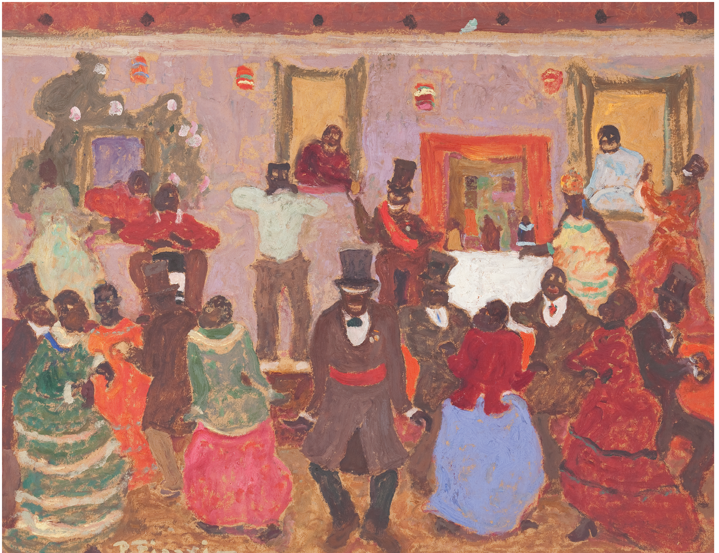
Pedro Figari Candombe Óleo sobre cartón, sin fecha. 60 x 80,5 cm. Museo Figari